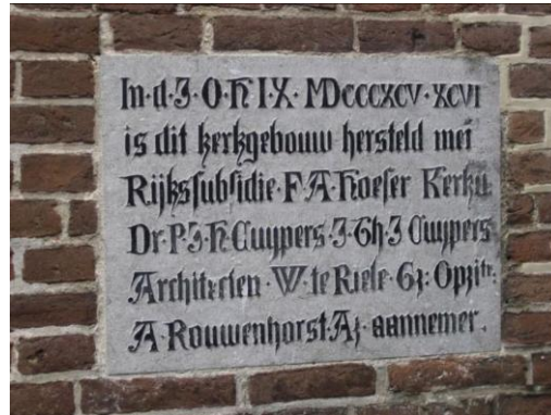
De gedenksteen van de generaal aan de zuidzijde van de Andreaskerk te Hattem