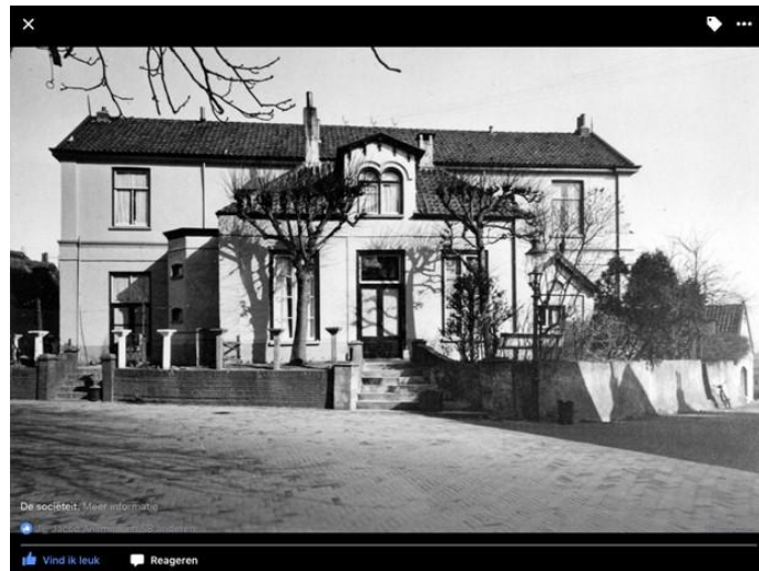
Kantoor van de stichting 19 e eeuw