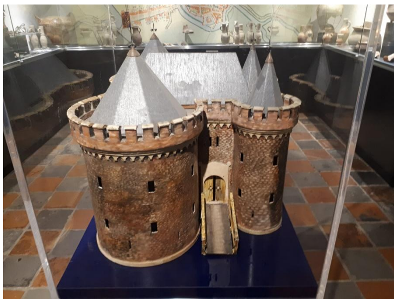
Schaalmodel van “De Dikke Tinne” in het Voerman Stadsmuseum te Hattem